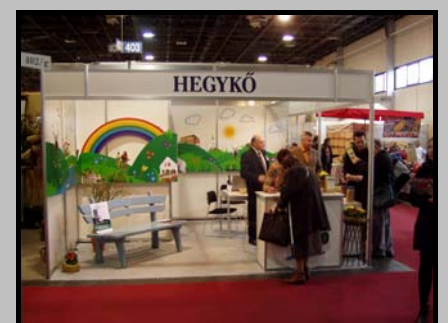
kép a hegykői standról

A tavalyi évhez hasonlóan a hegykői önkormányzat és a helyi idegenforgalmi vállalkozások (kereskedelmi szálláshelyek és a termálfürdő üzemeltetője) idén is közös standdal, megújult külsővel jelentek meg a neves kiállításon, Budapesten. Az érdeklődés a tavalyi közel kétszerese volt, ami örömmel és reménnyel tölthet el minden Hegykőit, hogy a jövőben még több vendég látogat el községünkbe és élményekben gazdagon viszi hírét e vidéknek.