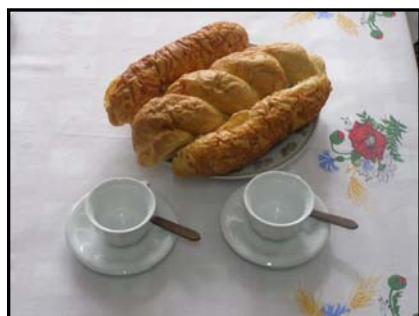
Sikeres sütést és jó étvágyat kívánok!

A lisztbe beletesszük a tojást, cukrot, vajat, sőt és a langyos tejben megfuttatott élesztőt és dagasztjuk. A tésztát kelni hagyjuk kb. 30percig, ha megkelt, négy rúdra kisodorjuk és mint a kislányok copfját, összefonjuk. Tepsibe tesszük, a tetejét megkenjük tojás sárgájával, megszórjuk cukorral, és előmelegített sütőben sütjük.