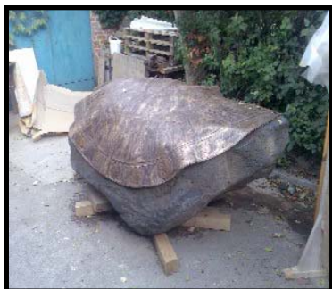
Az emlékmű viaszmintája

A Hegykői Önkormányzat képviselő testülete már a korábbi ciklusban megfogalmazta: "a Hősi kertet alkalmassá kell tenni arra, hogy a falu közössége méltó környezetben ünnepelhesse, emlékezhessen". 2007-ben felmerült annak lehetősége, hogy a Hősi kertben szobrok áthelyezésével, vagy egy új szobor felállításával a park méltó környezetet kapjon, így a régi terv végre megvalósulhat. A korábbi elképzeléseket illetően felerősödött az érzés, hogy a Hősi kert nyerje vissza a régi tiszteletét.